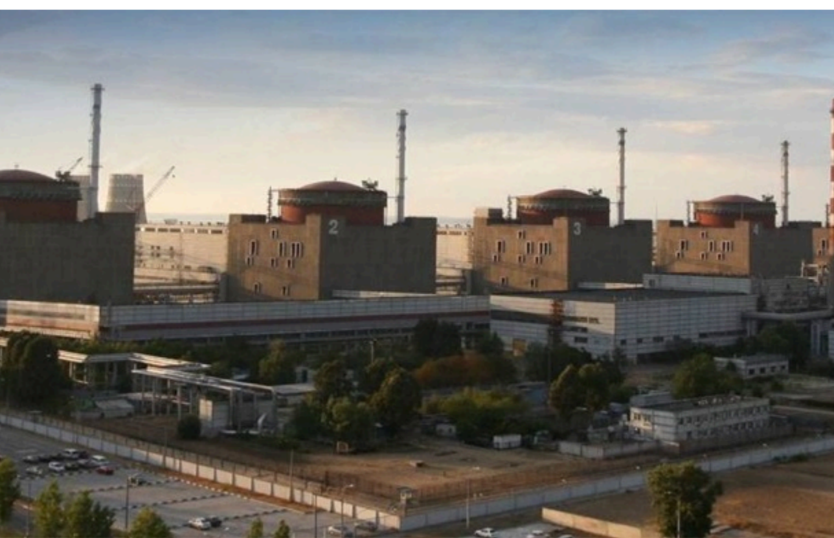
Запорізька АЕС п'ятий рік перебуває під російською окупацією

13 червня 2026 року о 14:30 відновлено зовнішнє електроживлення тимчасово окупованої Запорізької АЕС, повідомили в Енергоатомі.