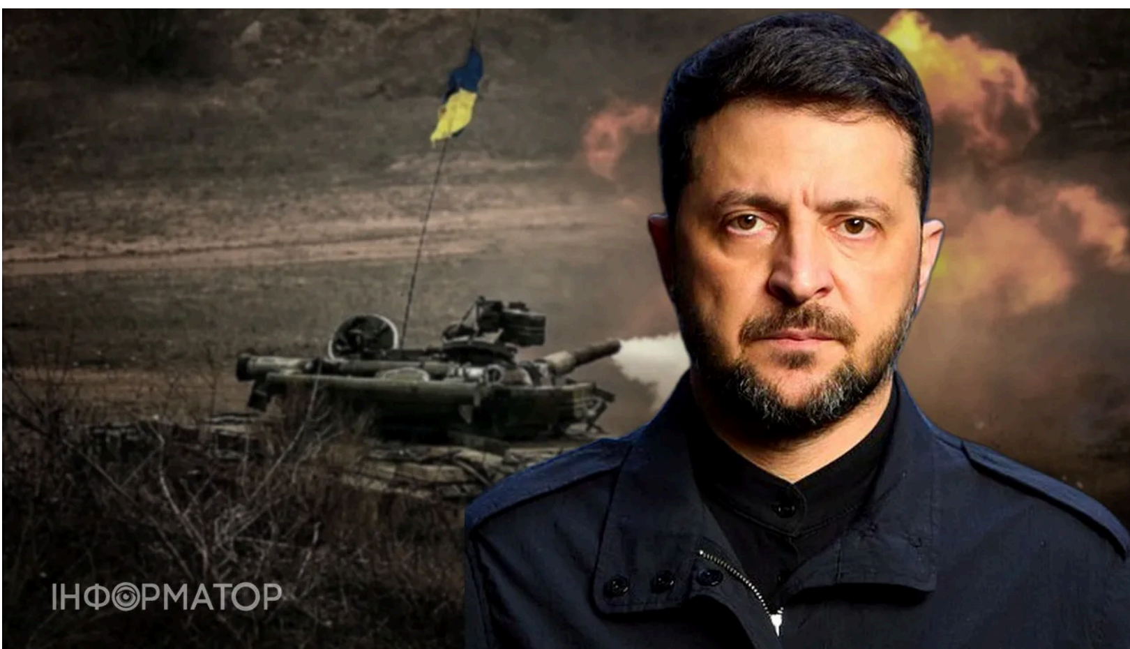
Влада розглядає заморозку війни до зими

Команда президента України Володимира Зеленського в закритих обговореннях розглядає сценарій завершення або заморозки війни протягом найближчих шести місяців . На Банковій вважають нинішній момент найбільш сприятливим для переговорів і ключовим елементом плану бачать пряму зустріч двох президентів. Водночас у дипломатичних колах такі розрахунки піддають сумніву - Кремль, на думку аналітиків, здатен використати будь-який формат діалогу для банального затягування часу.