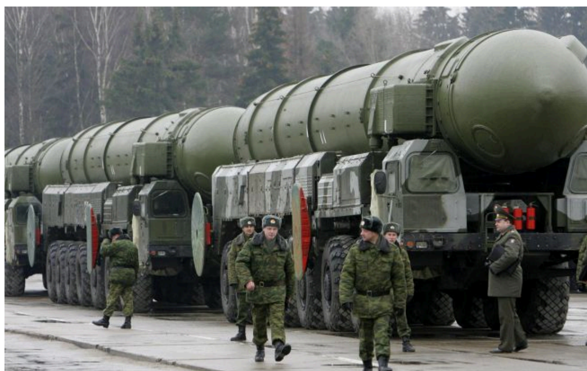
Фото: Берлін озвучив підозри щодо ядерних планів Росії в космосі (РосЗМ)