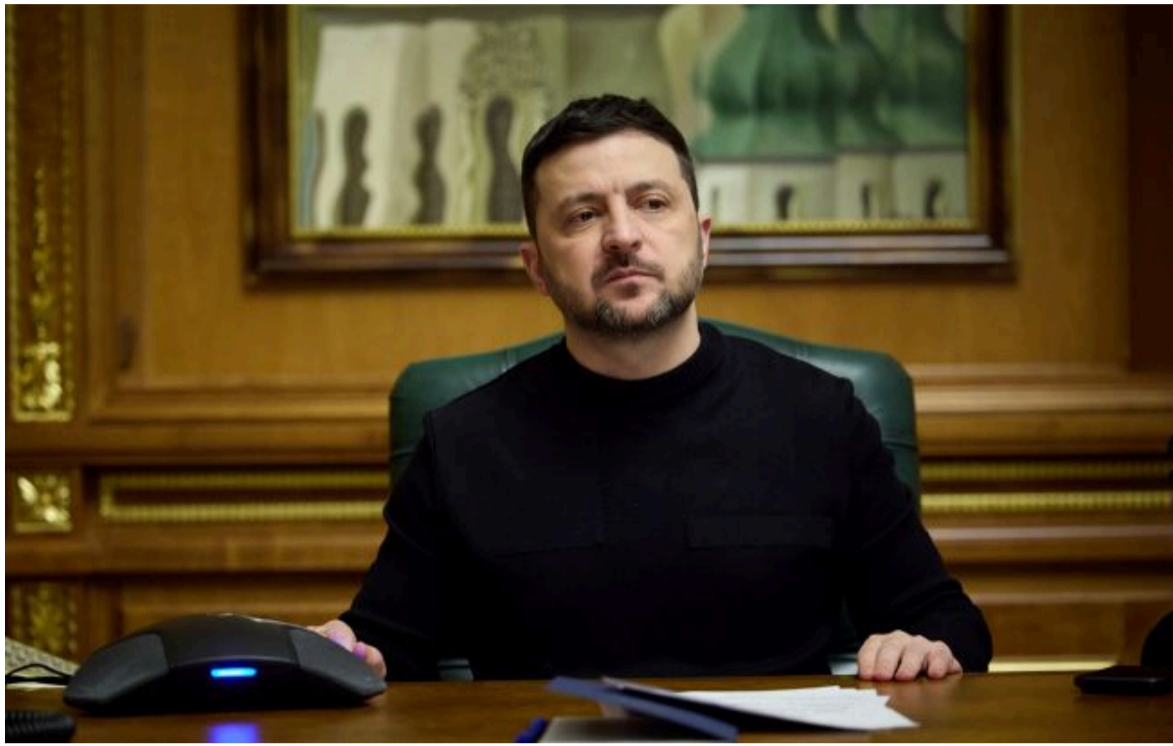
президент України Володимир Зеленський