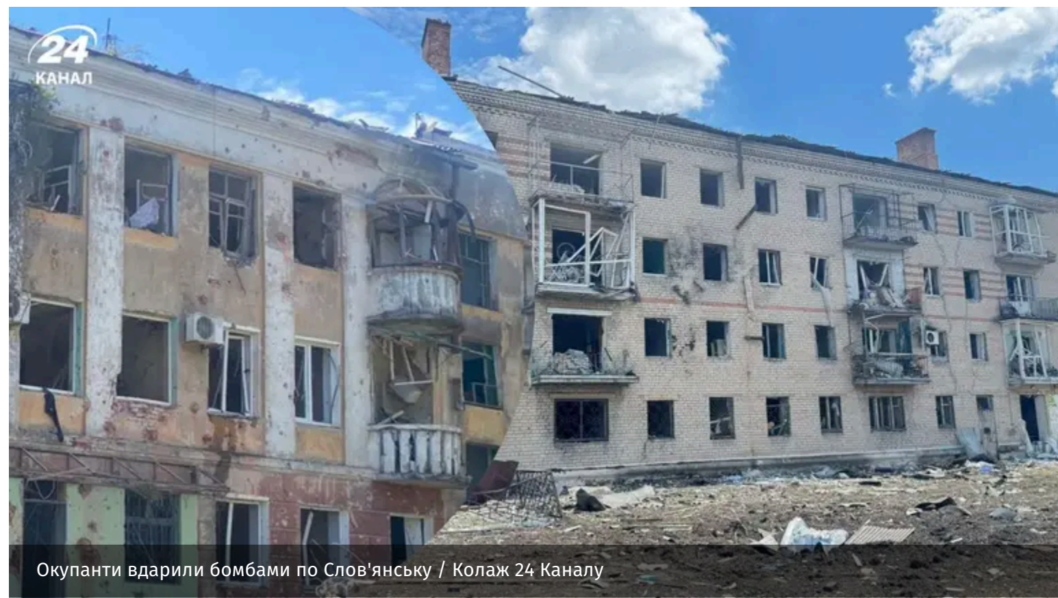
Окупанти вдарили бомбами по Слов'янську

13 червня вранці окупанти скинули на Слов'янськ три "ФАБ-250" з УМПК. Удари припали на житлову забудову.