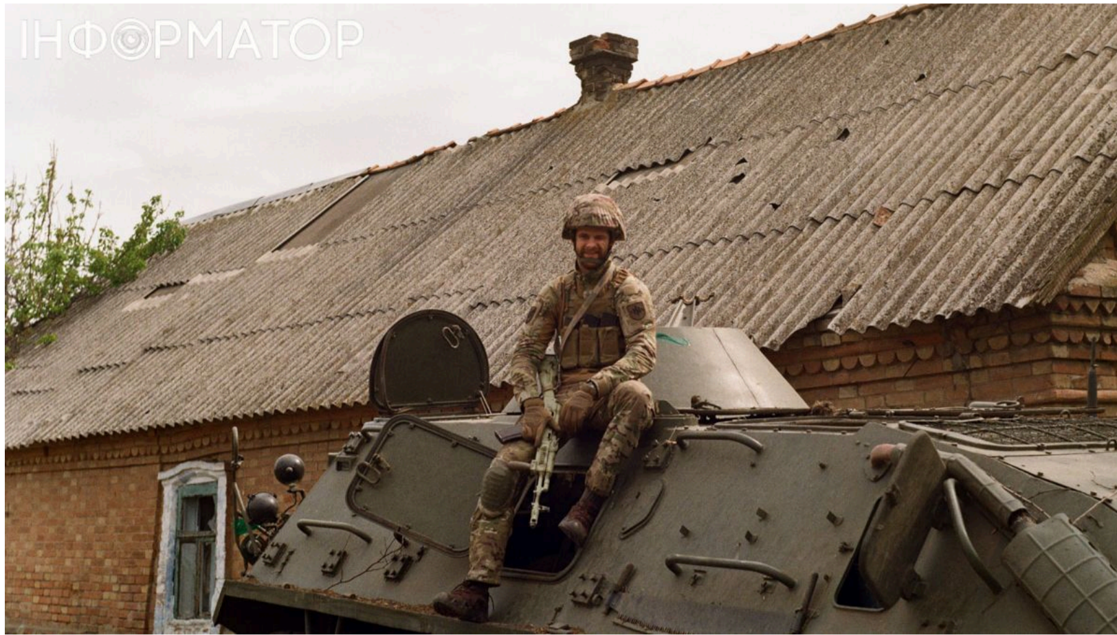
Армія+ запрошує військових у СЗЧ до 55 підрозділів.

Міністерство оборони запустило спрощений механізм повернення на службу для військових, які самовільно залишили частину. Також реформа умов служби в ЗСУ передбачає підвищення виплат і нові формати контрактів. Міноборони відкрило для СЗЧ можливість самостійно обрати підрозділ і повернутися до строю в обхід тривалих процедур.