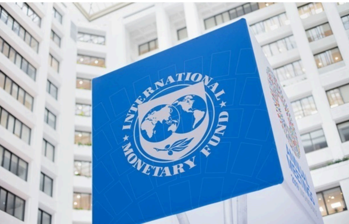
МВФ і уряд України досягли домовленості про транш $690 млн

Скасування податкових пільг на послитки та реформування спрощеної системи оподаткування - серед головних вимог місії МВФ.