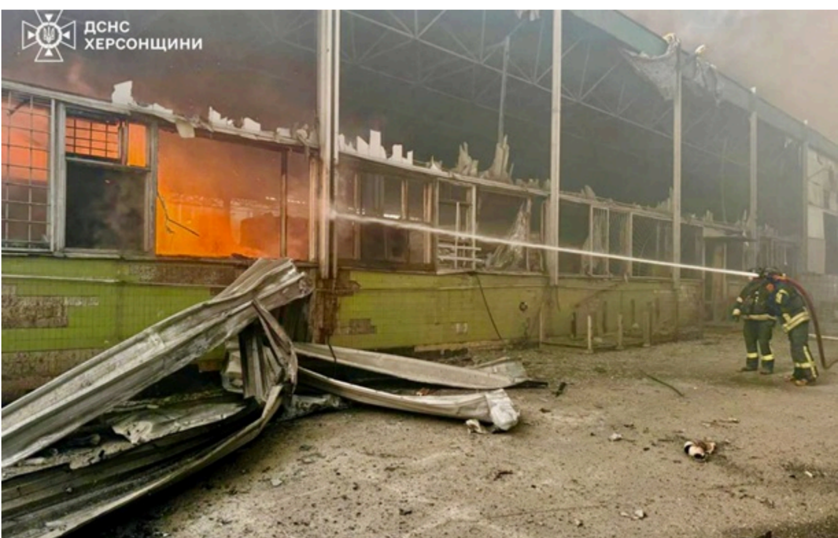
Наслідки чергового російського удару по Херсону

Виникла пожежа у двох складських приміщеннях. Рятувальники, працюючи під постійною загрозою атак ворожих дронів, загасили вогонь.