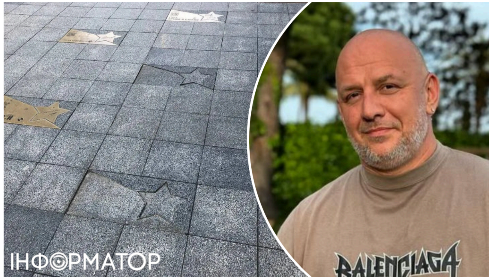
Потап відреагував на демонтаж зірки у Києві

Репер і продюсер Потап (Олексій Потапенко) публічно відреагував на зникнення своєї іменної таблички з "Алеї зірок" біля торгового центру "Гулівер" у Києві. Він написав саркастичний допис і одразу ж запропонував заміників - молодих українських виконавців, які, на його думку, заслуговують на місця дуету. Про зникнення табличок стало відомо 9 червня.