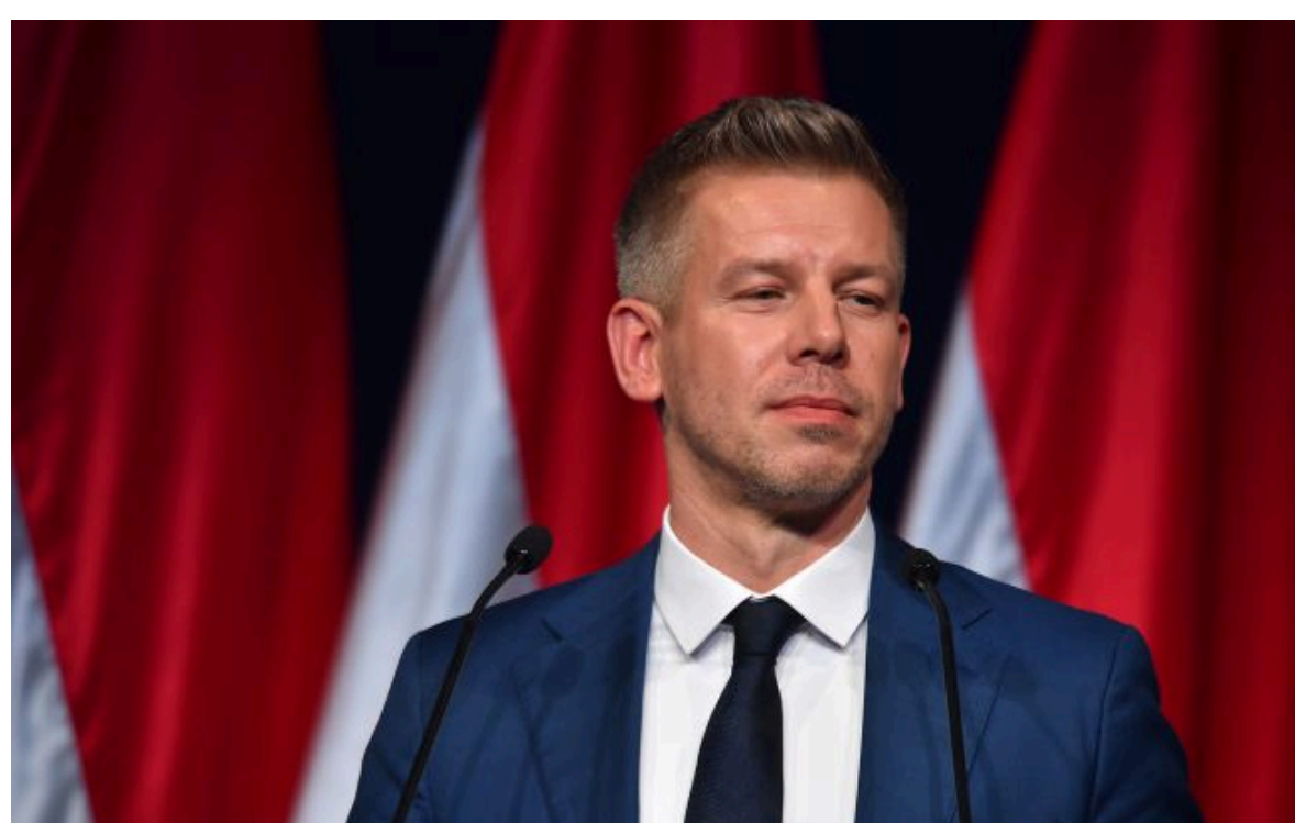
Фото: прем'єр-міністр Угорщини Петер Мадяр