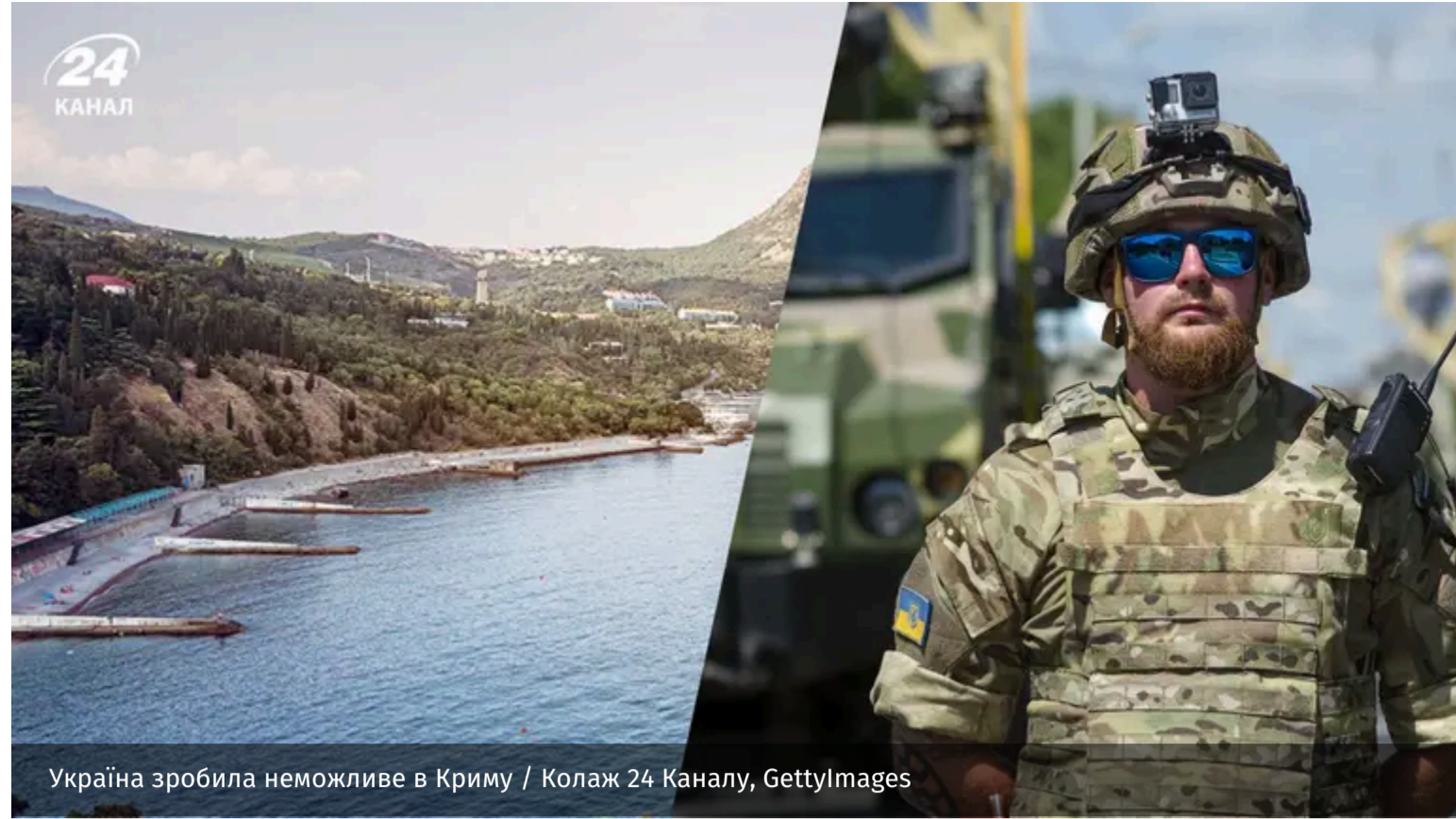
Україна зробила неможливе в Криму

Україна поступово відрізає Крим від логістичного зв'язку з Росією, що фактично позбавляє півострів функції безпечного тилу для російських військ на півдні. Також це вже позначилося на цивільному житті.