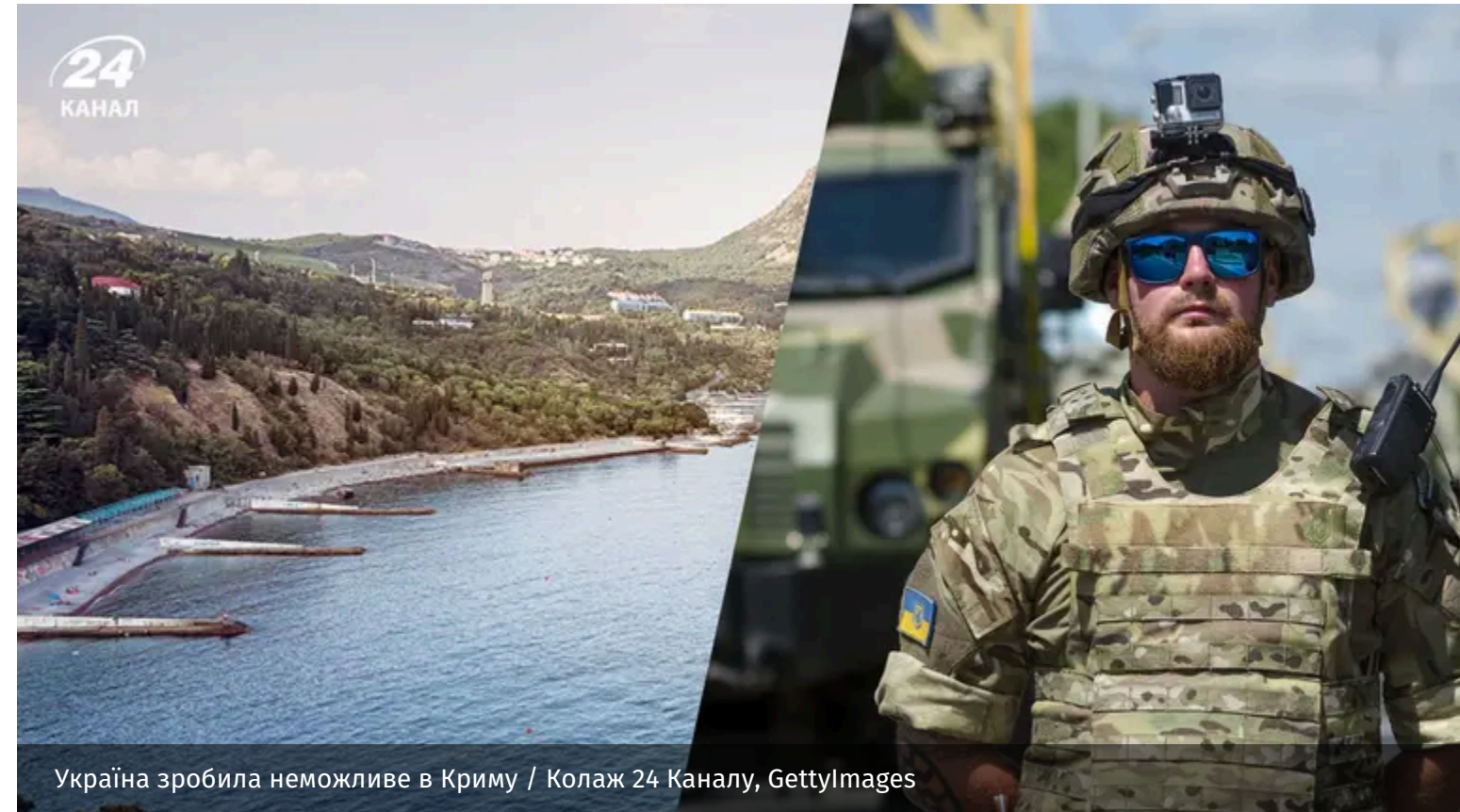
Україна зробила неможливе в Криму

Україна поступово відрізає Крим від логістичного зв'язку з Росією, що фактично позбавляє півострів функції безпечного тилу для російських військ на Півдні. Також це вже позначилося на цивільному житті.