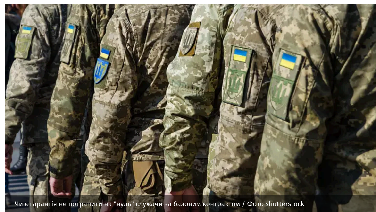
Чи є гарантія не потрапити на "нуль" служачи за базовим контрактом

Міністерство оборони України запроваджує нові формати контрактної служби, серед яких базовий контракт для виконання завдань поза бойовими частинами. Водночас у відомстві уточнюють, що повністю виключити ризик участі в бойових діях неможливо.