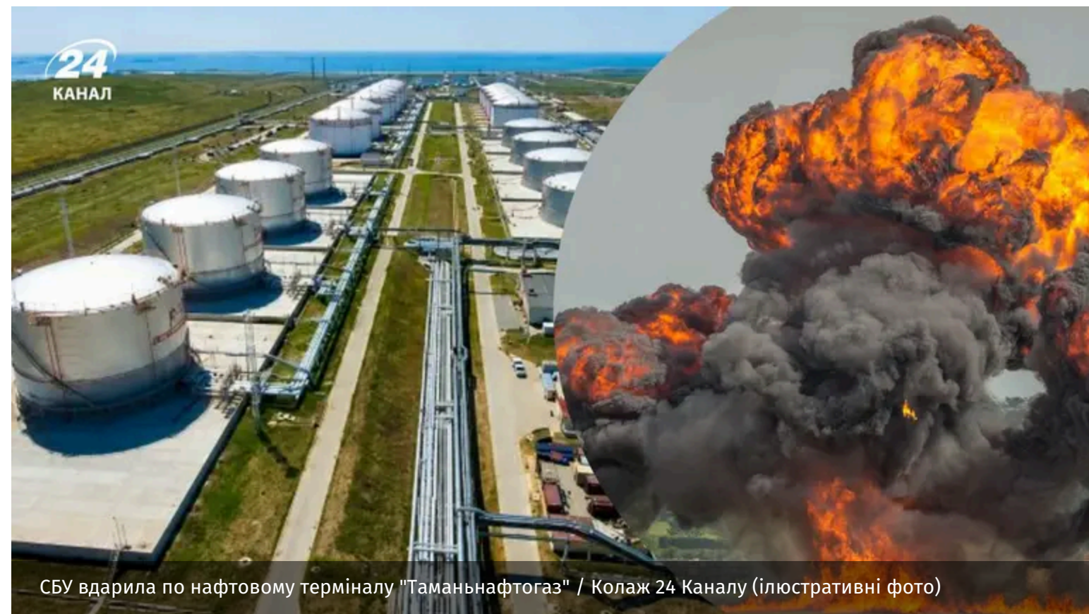
СБУ вдарила по нафтовому терміналу "Таманьнафтогаз"

Українські військові провели успішну атаку на нафтогазоносний термінал "Таманьнафтогаз" у Краснодарському краї Росії. Під удар потрапили й позиції ППО країни-агресорки.