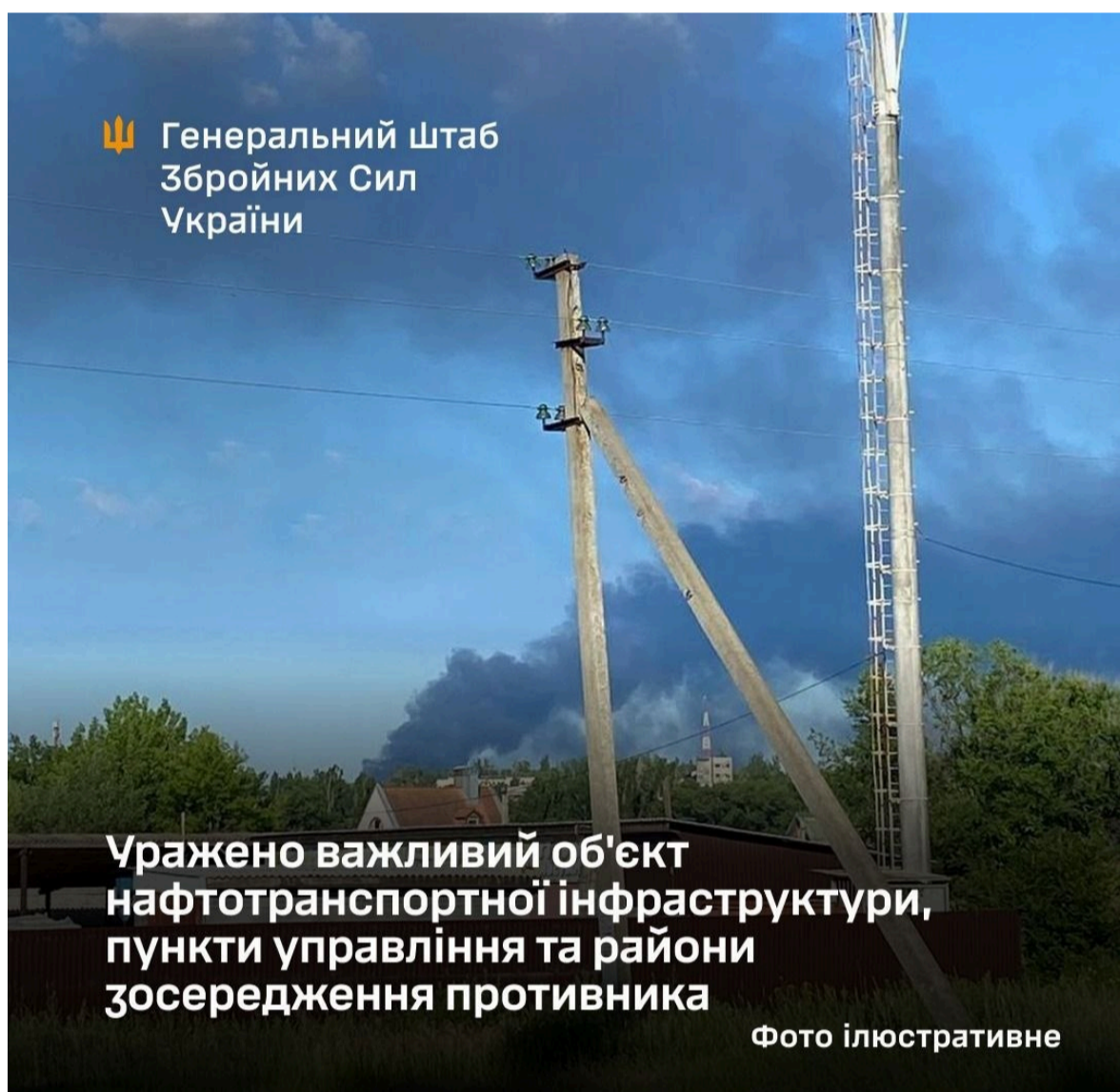
Фото: які важливі об'єкти ворога уразили ЗСУ

Окрім нафтобази, українські військові вдарили по пунктах управління окупантів у районах Соледара (Донецька область) та Верхньої Криниці (Запорізька область).