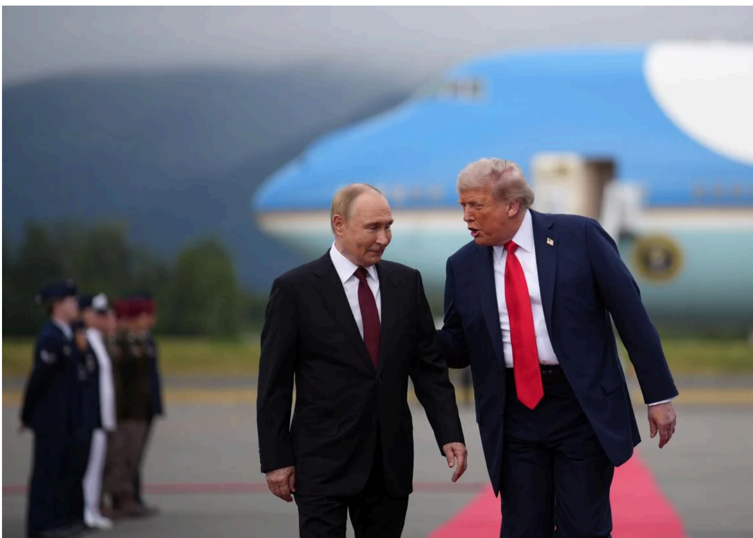
Зустріч президента США Дональда Трампа з главою РФ Володимиром Путіним в Анкориджі, штат Аляска, 15 серпня

Лідери, які потрапили в таку пастку влади, є небезпечними, вважає оглядач.