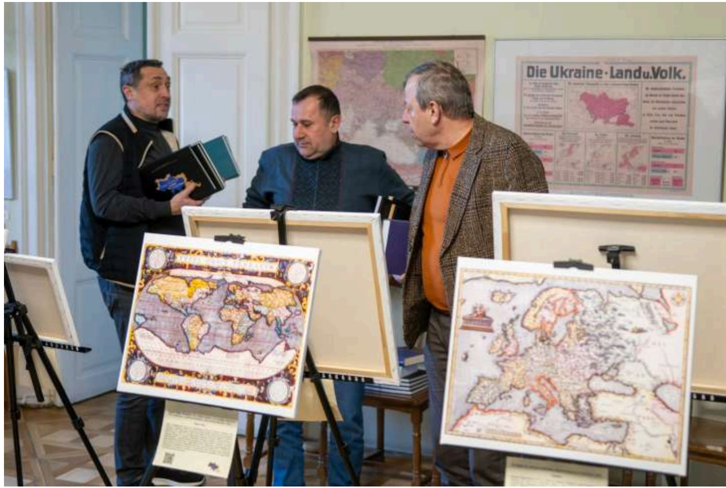
Львівська національна наукова бібліотека України імені Василя Стефаника

На думку експертів, саме поєднання підтримки спорту, культури та науки є характерною рисою сучасного українського меценатства, яке поступово формує нові стандарти соціальної відповідальності.