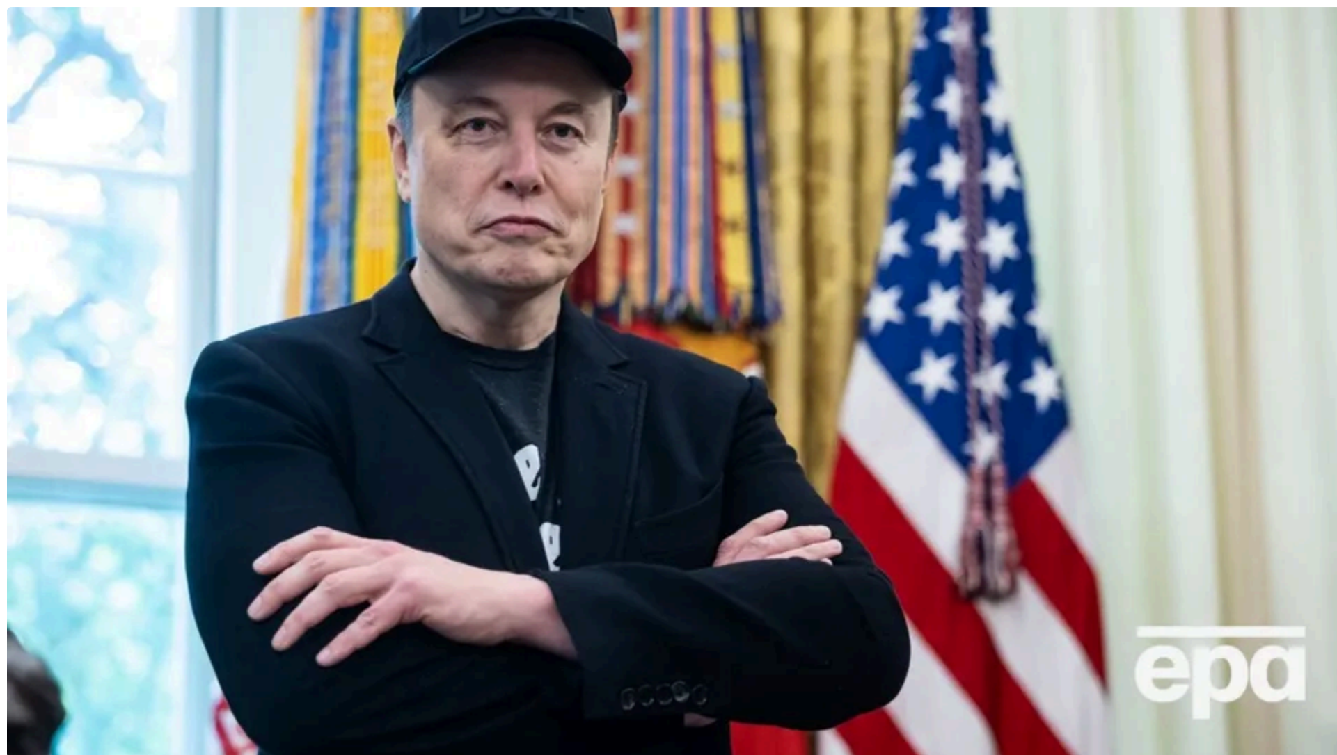
ЗМІ підраховали, що можна було б купити за статки Маска

13 червня, 13:19 🗣️ Этот материал также можно прочитать на русском