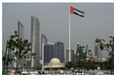
ОАЕ заплатять Ірану $20 млрд за припинення атак - ЗМІ 10:02