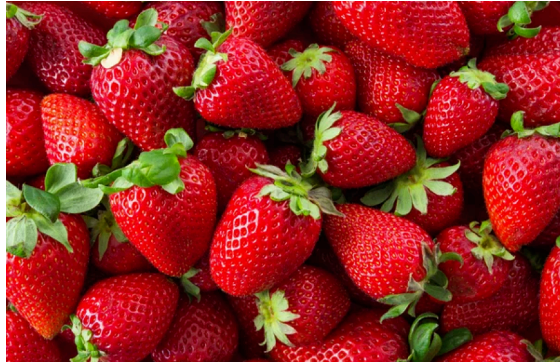
Імпортна полуниця змушує виробників знижувати ціни

В Україні другий тиждень поспіль знижуються ціни на полуницю. Через стрімке збільшення пропозиції ягоди з південних регіонів та стриманий попит виробники були змушені знизити відпускні ціни в середньому на 21%.