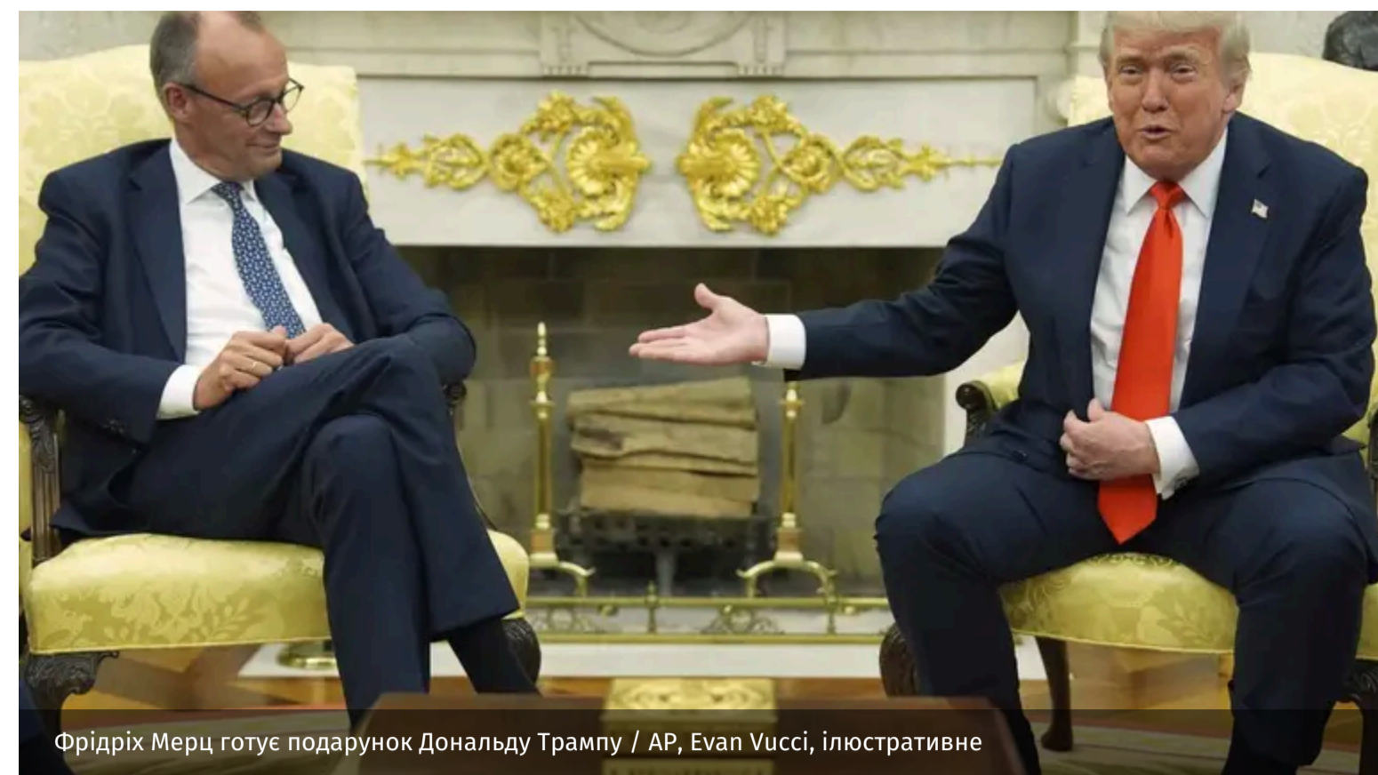
Фрідріх Мерц готує подарунок Дональду Трампу / AP, Evan Vucci, ілюстративне

Канцлер Німеччини Фрідріх Мерц підготував для Дональда Трампа особливе привітання з нагоди 80-річчя американського президента, яке буде незабаром.