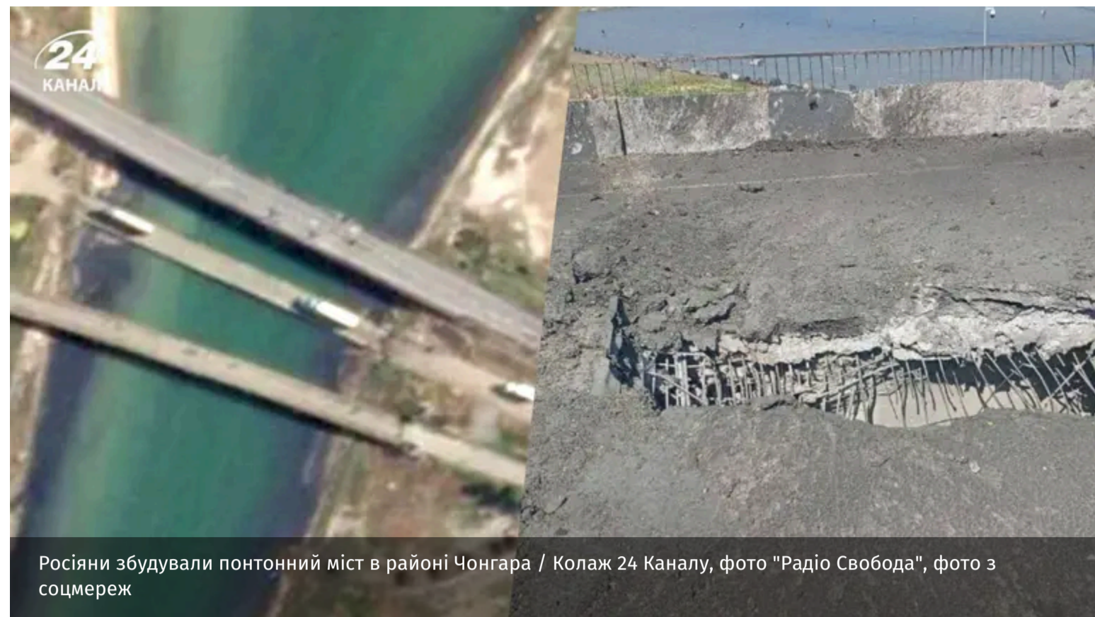
Росіяни збудували понтонний міст в районі Чонгара

Українські військові знищили Чонгарський міст, який з'єднував Херсонщину та Крим. Натомість окупанти збудували поруч понтонну переправу.