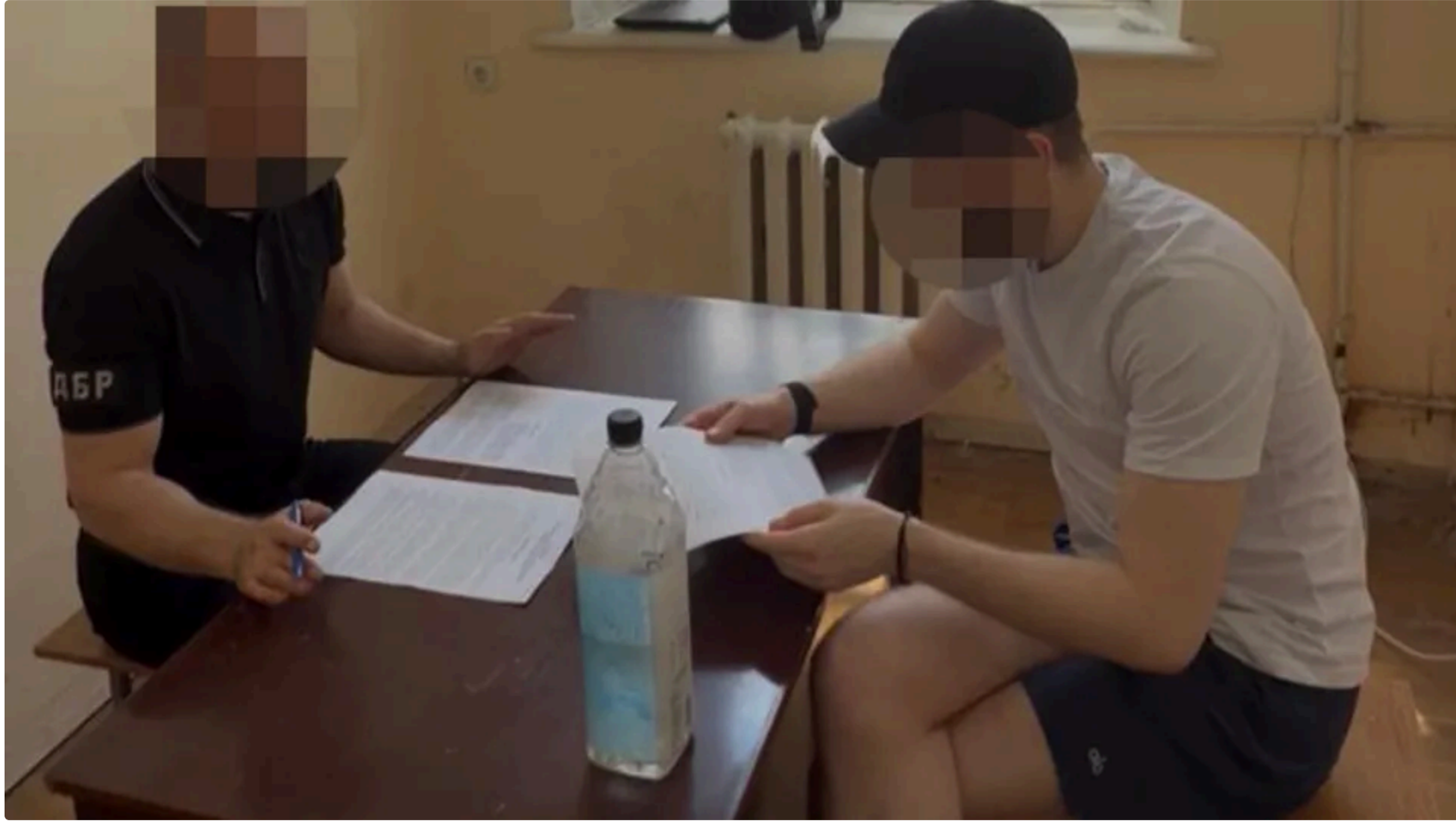
Експосадовець Міноборони, за даними слідства, сприяв львівським бізнесменам за хабарі під час контрактів

13 червня, 10.37 🗨️ Этот материал также можно прочитать на русском