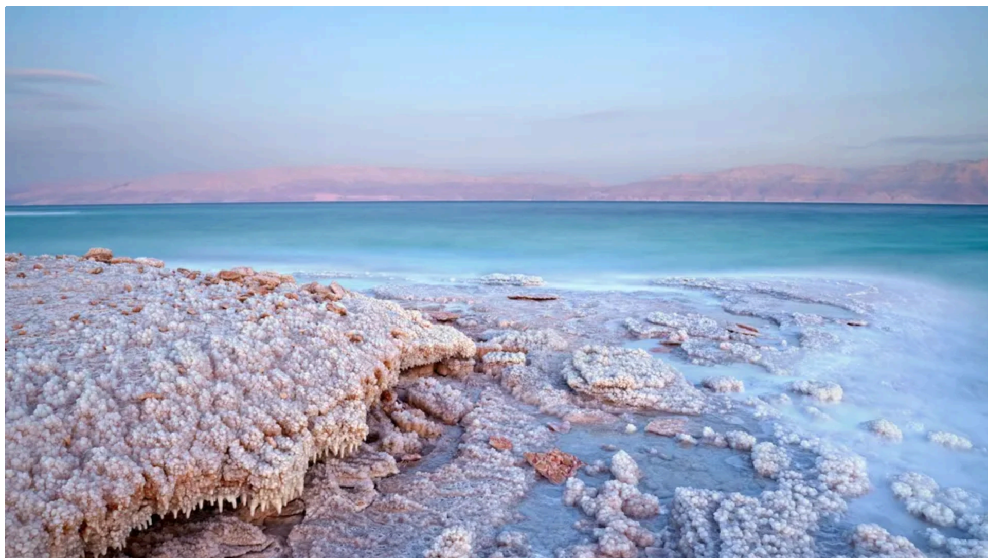
За п'ять десятиліть площа озера скоротилася приблизно на третину

13 червня, 09.34 Этот материал также можно прочитать на русском