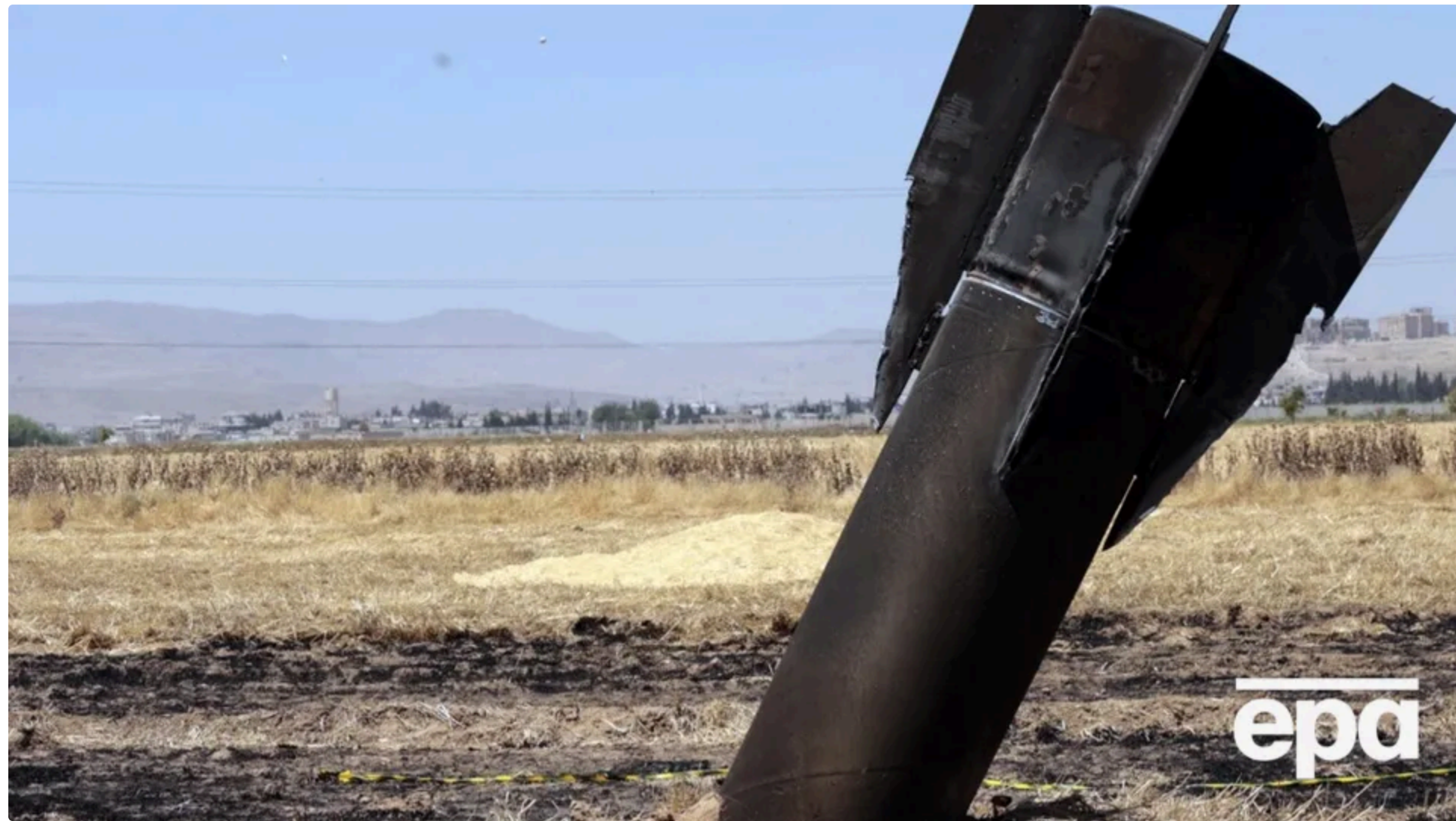
Іран за час конфлікту випустив понад 1850 ракет

За оцінками західних розвідок, за вісім тижнів припинення вогню на Близькому Сході Іран, найімовірніше, поповнив свій ракетний арсенал новою російською зброєю. Про це 12 червня інформує Bloomberg.