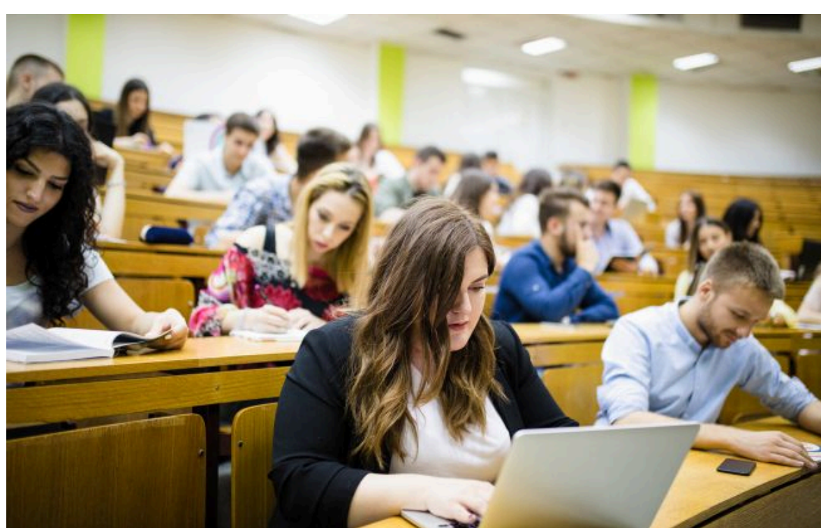
Фото: студентам підвищать стипендії з 1 вересня