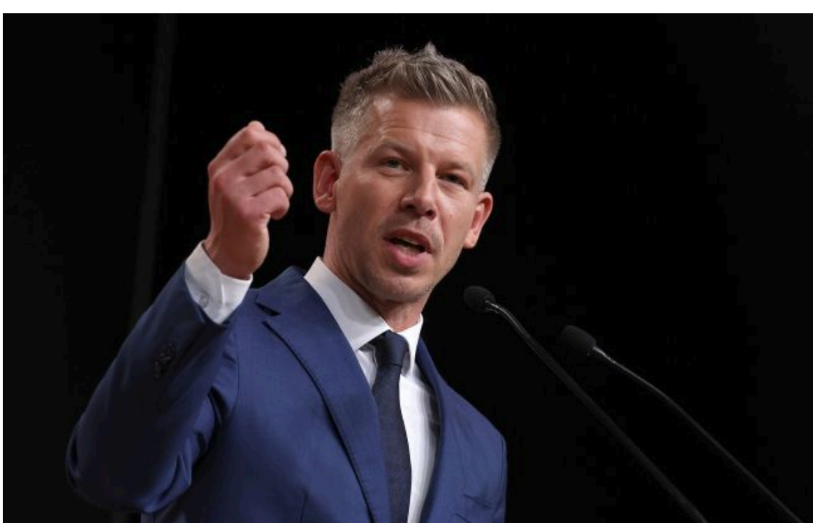
Фото: прем'єр Угорщини Петер Мадяр