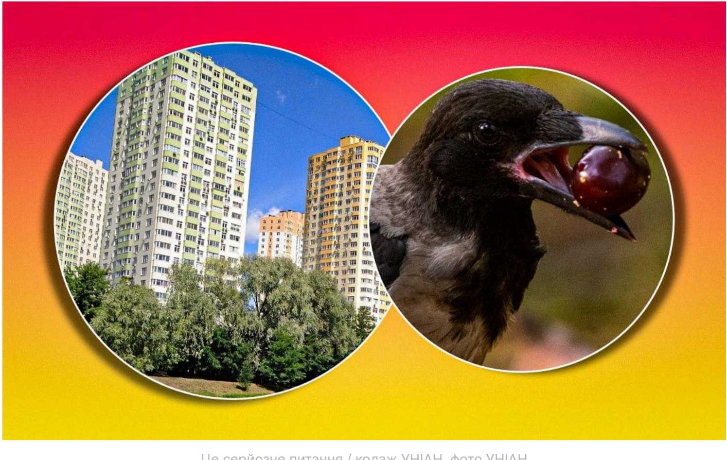
Це серйозне питання

Посадити квіти під вікнами або зрубати дерево, що заважає, здається, дрібницею, але навіть це потребує погодження.