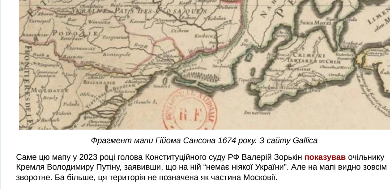
Фрагмент мапи Гійома Сансона 1674 року.

На європейських мапах 17 століття окрім назви «України» також українські землі часто позначали як землю козаків. Так, на мапі 1674 року картографа Гійома Сансона, якого ще називали «батьком французької картографії», є напис: Ukraine pays des cosaques (Україна – країна козаків). На мапі видно, що частина Південної України, за винятком Кримського ханства та Османської імперії, входить до складу землі козаків.