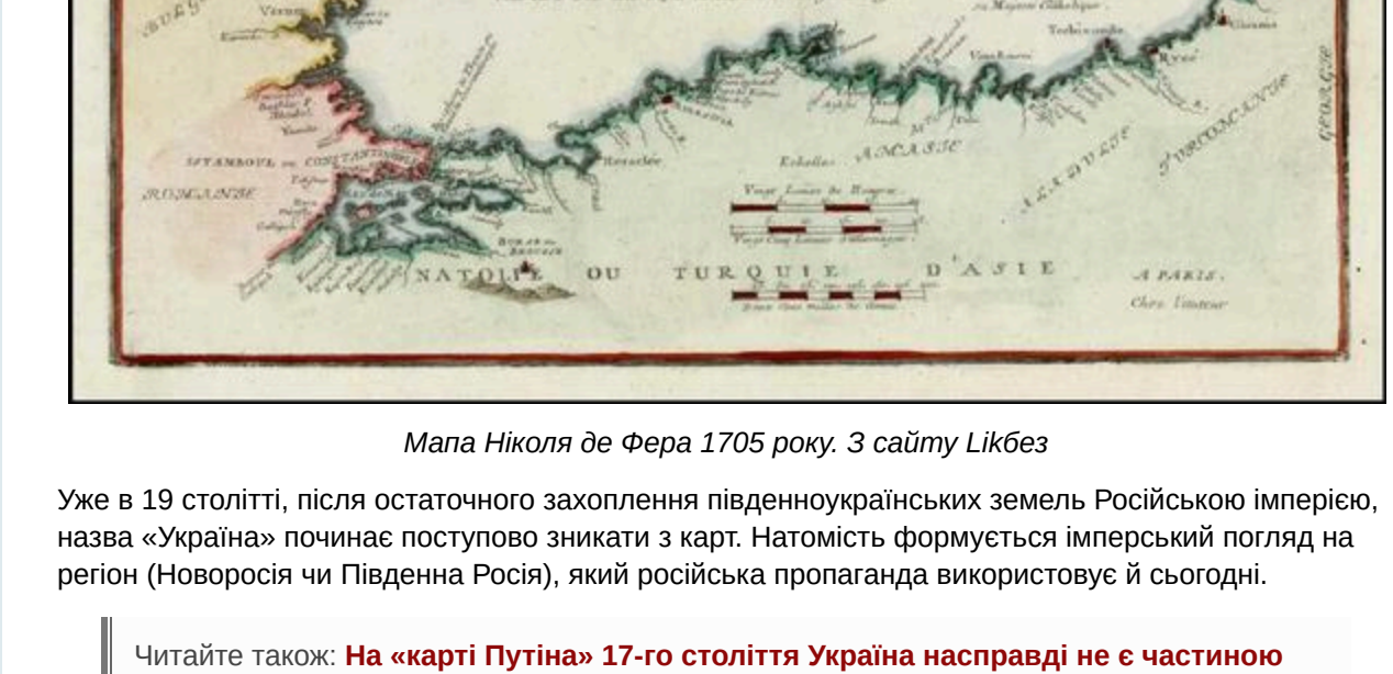
Мапа Нікола де Фера 1705 року.

Південна Україна в європейській картографії 18 століття також пов'язана з топонімом «Україна». На мапі французького картографа Нікола де Фера частина сучасних Миколаївської та Одеської області позначена як «Землі козаків або України». Іншими словами, європейці чорноморський регіон пов'язували не лише з Кримським ханством, а й із запорозькими козаками.