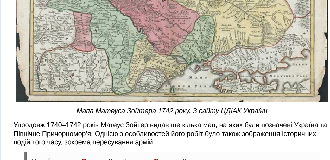
Мапа Матеуса Зойтера 1742 року. З сайту ЦДІАК України

Також мапа містить велику кількість географічних назв – населених пунктів, річок, лісів і шляхів – на території Молдавії, Криму, вздовж Дніпра та Валахії.