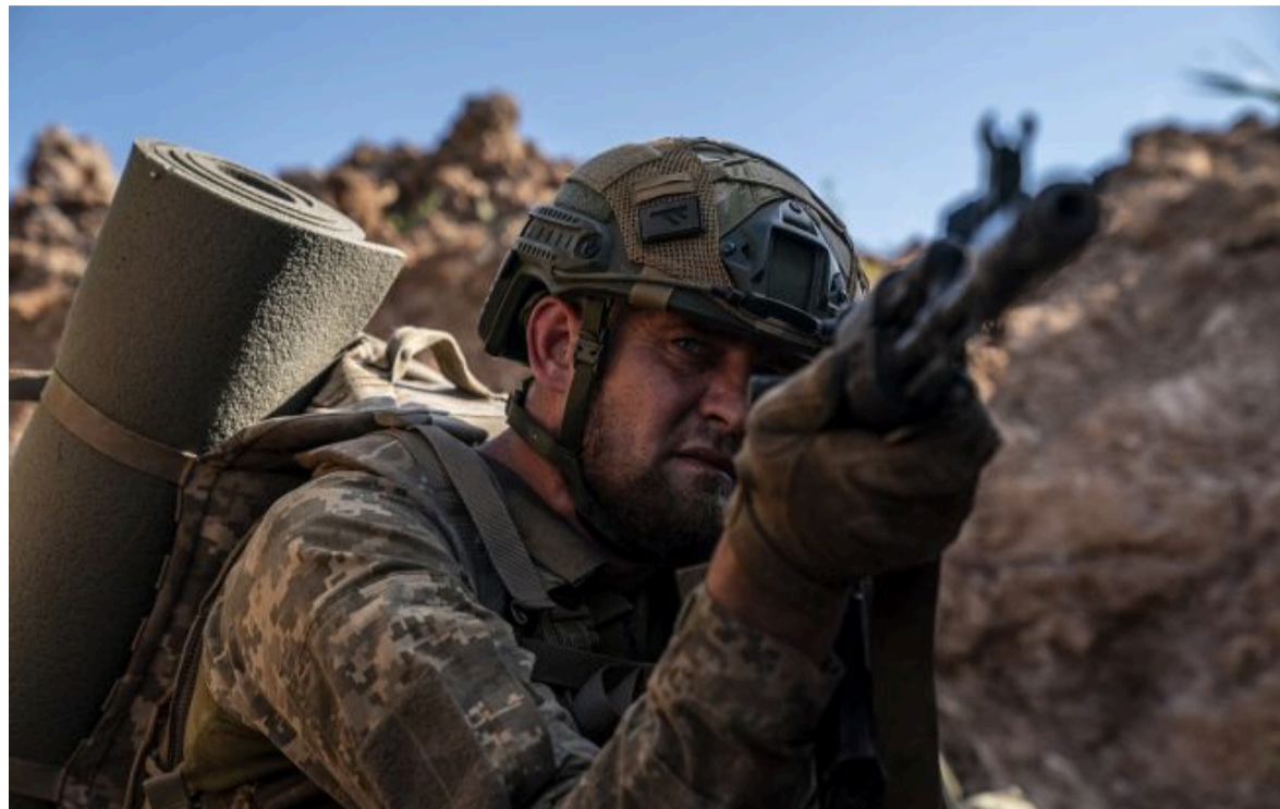
Фото: Міноборони розповіло про базовий контракт для ЗСУ (Getty images)