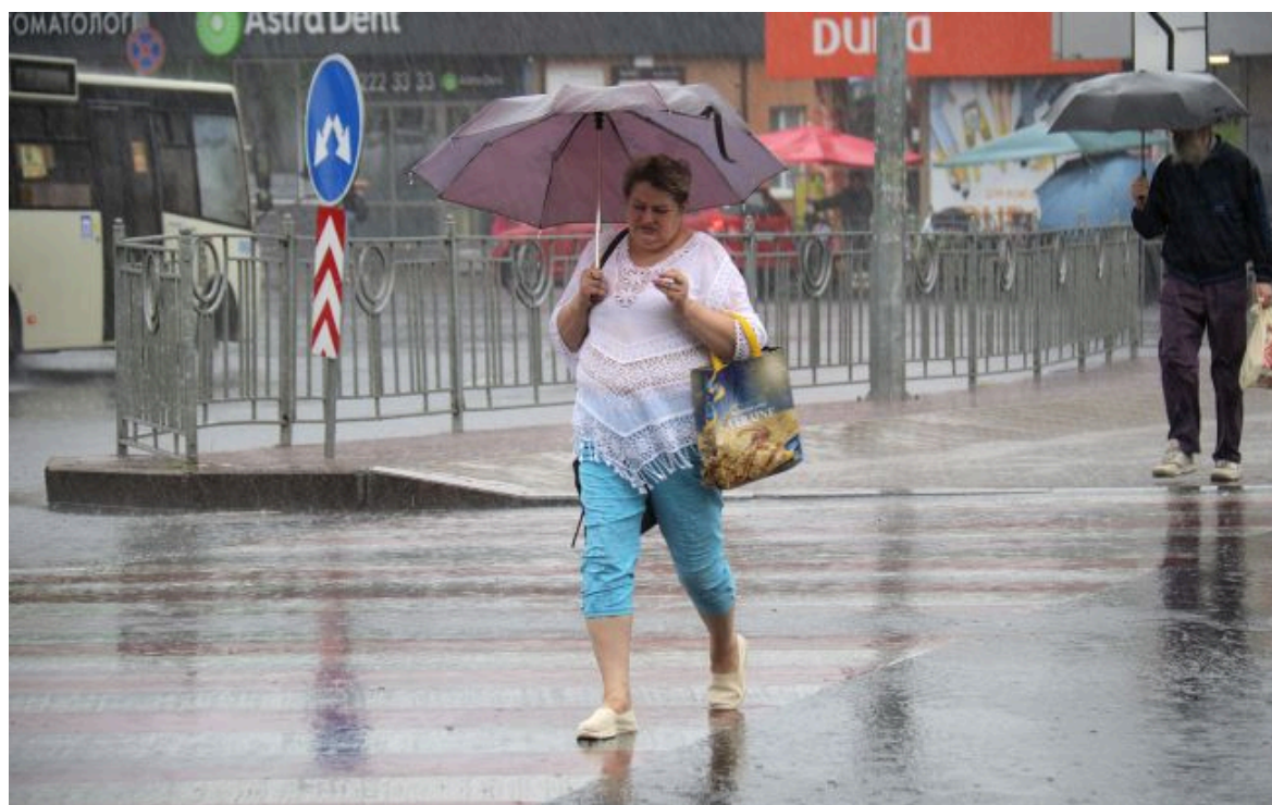
Фото: синоптики дали прогноз погоди на 13 червня

Стихія не застане зненацька! Слідкуй за змінами погоди з РБК-Україна у Google