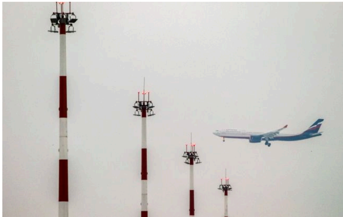
Фото: до санкційних проблем російських авіаперельотів додалися нові (Getty Images)