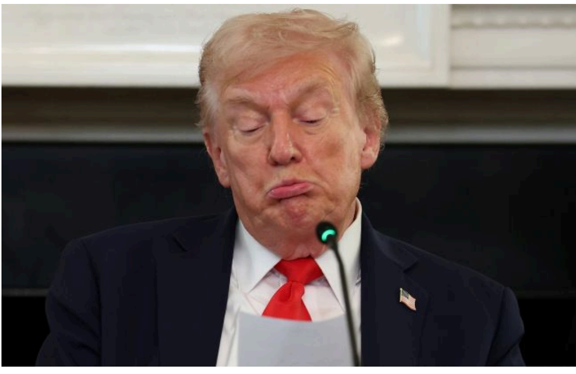
Фото: президент США Дональд Трамп

Вимкни хаос міжнародних новин! Отримуй тільки важливе з РБК-Україна у Google