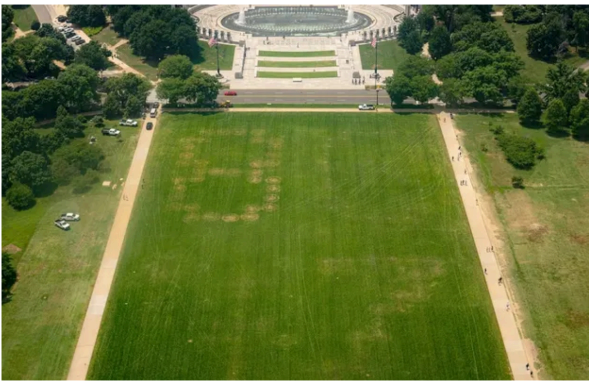
Напис в парку став причиною глобального розслідування спецслужб США

Це старий ресторанный сленг, який означає "позбутись чогось". На професійній кухні слово "eighty-six" (86) означає, що якась позиція в меню закінчилася, або що клієнту більше не можна наливати алкоголь через його поведінку (його "виставляють" за двері).