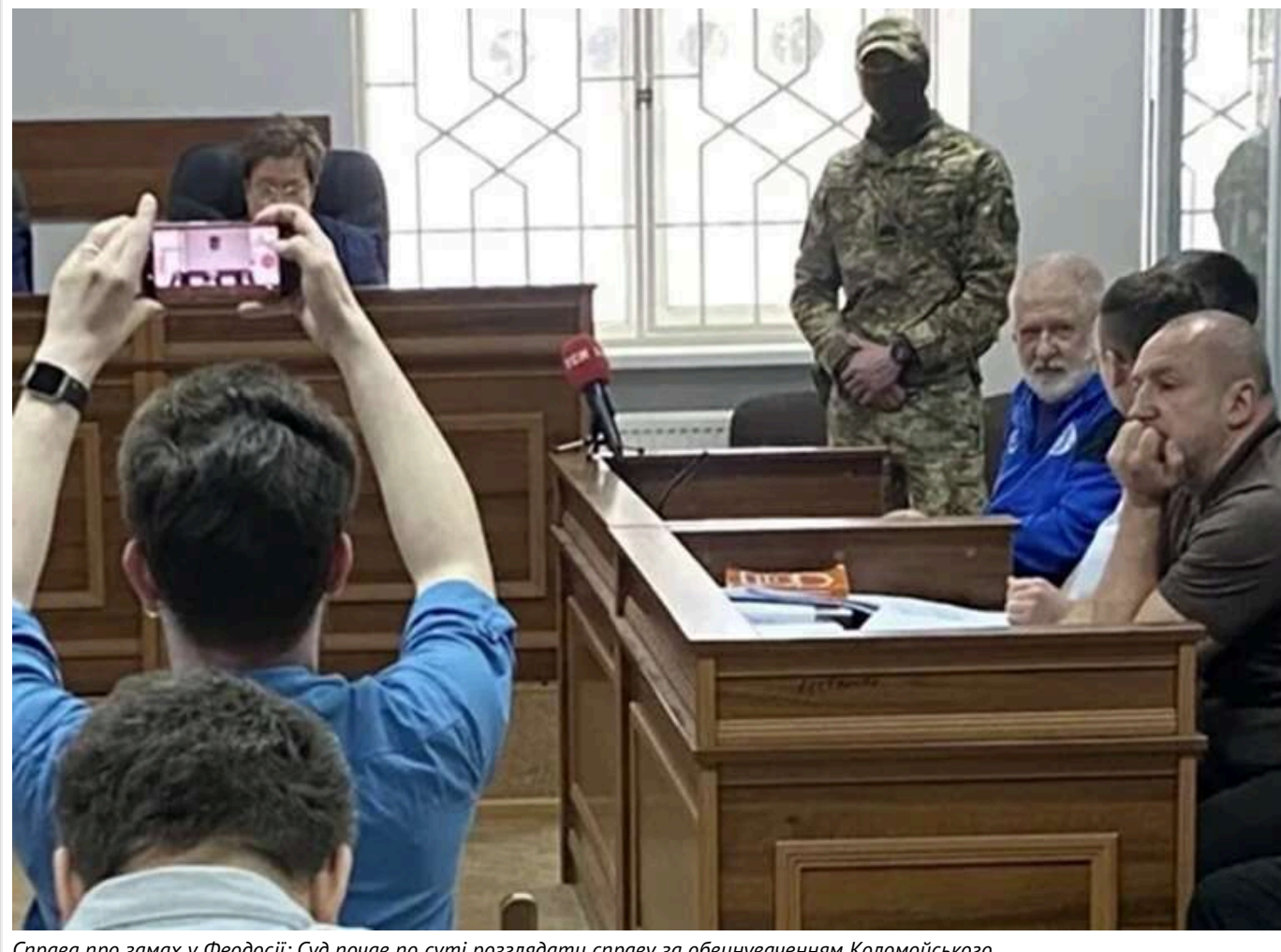
Справа про замах у Феодосії: Суд почав по суті розглядати справу за обвинуваченням Коломойського

Читати на руськом Read in English Додати як бажане джерело в Google