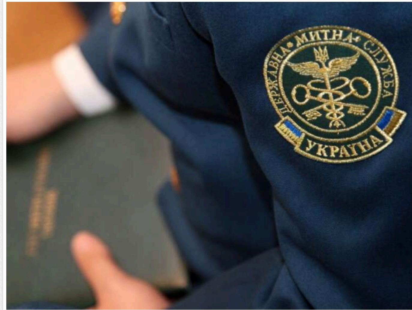
Апеляційний суд скасував конфіскацію великої партії насіння канабісу з Іспанії через помилки митниці

Львівський апеляційний суд розглянув апеляційну скаргу на постанову суду першої інстанції щодо конфіскації великої партії елітного насіння канабісу, виявленого в міжнародному поштовому відправленні. Апеляційний суд скасував рішення через те, що митники та суд першої інстанції припустилися серйозних помилок при ідентифікації особи відправника.