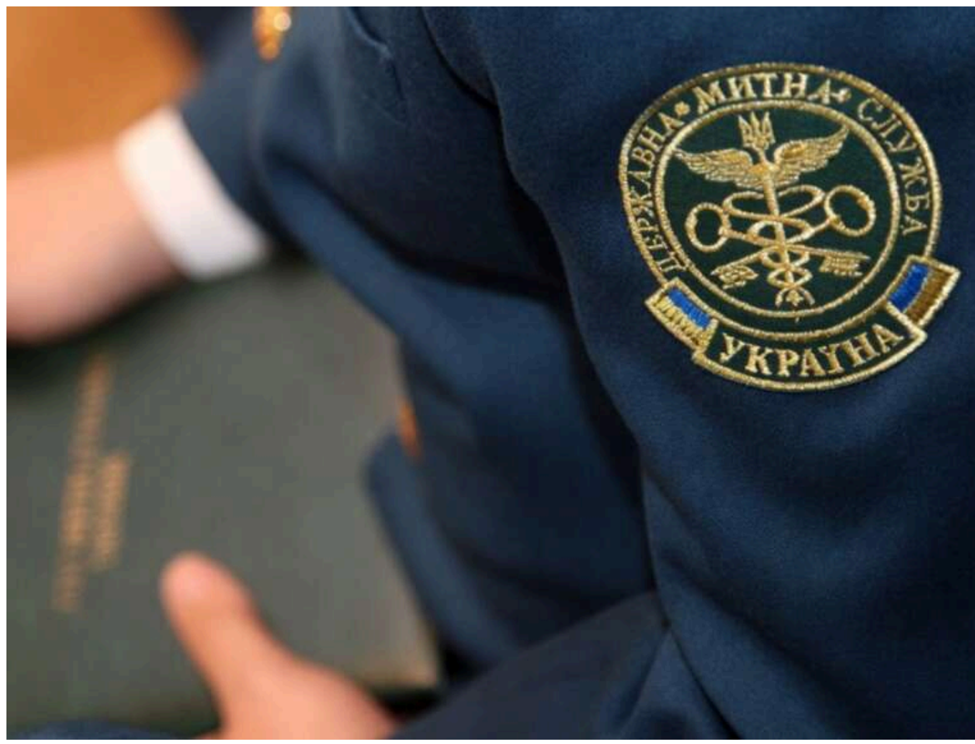
Апеляційний суд скасував конфіскацію великої партії насіння канабісу з Іспанії через помилки митниці

Львівський апеляційний суд розглянув апеляційну скаргу на постанову суду першої інстанції щодо конфіскації великої партії елітного насіння канабісу, виявленого в міжнародному поштовому відправленні. Апеляційний суд скасував рішення через те, що митники та суд першої інстанції припустилися серйозних помилок при ідентифікації особи відправника.