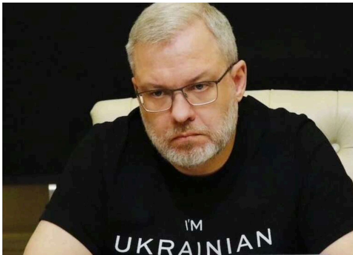
За ексміністра Германа Галуценка готуються внести заставу

Читати на руськом Read in English Додати як бажане джерело в Google