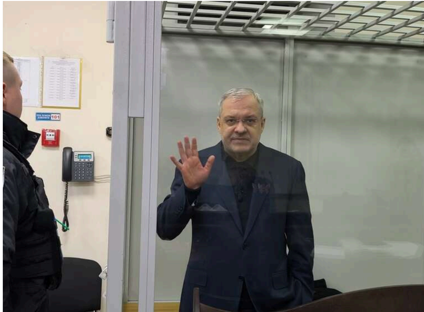
ВАКС залишив під вартою ексміністра енергетики Галущенка, але зменшив заставу до 150 мільйонів гривень

Читати на руськом Read in English Додати як бажане джерело в Google