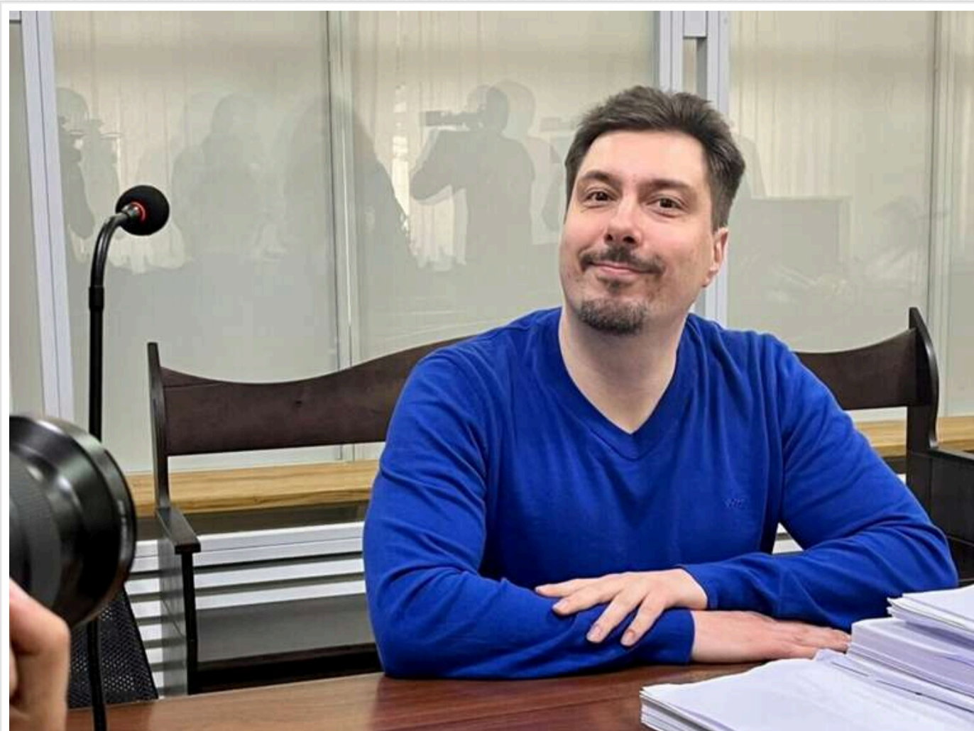
Хабар на 2,7 мільйона доларів в інтересах Жеваго: як розслідування проти Князева переросло у найбільшу чистку у Верховному суді

Читати на руськом Read in English Додати як бажане джерело в Google