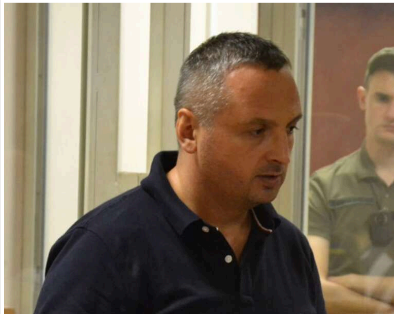
Родич Гончаренка завищив ціни у 6 разів: ексдепутата Одеської облради Дерев'янка засудили до 4,5 років за корупційну схему

Читати на руском Read in English Додати як бажане джерело в Google