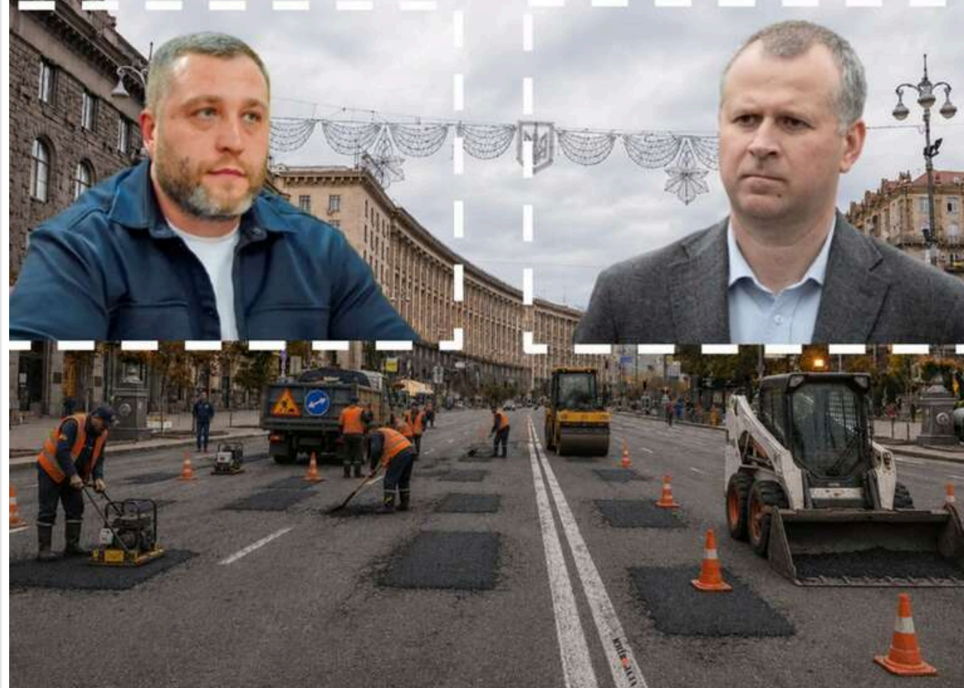
Мільйони на латання ям: скільки коштував ремонт Хрещатика під час війни та чому велика реконструкція на паузі

Час від часу на спаленому Хрещатику можна помітити ремонтну техніку, яка ліквідує ями та інші локальні дефекти покриття. На цьому тлі регулярно лунають заклики у бік київської влади про бюджетні витрати на перекладання асфальту та бручків там, де потреби в цьому начебто і немає.