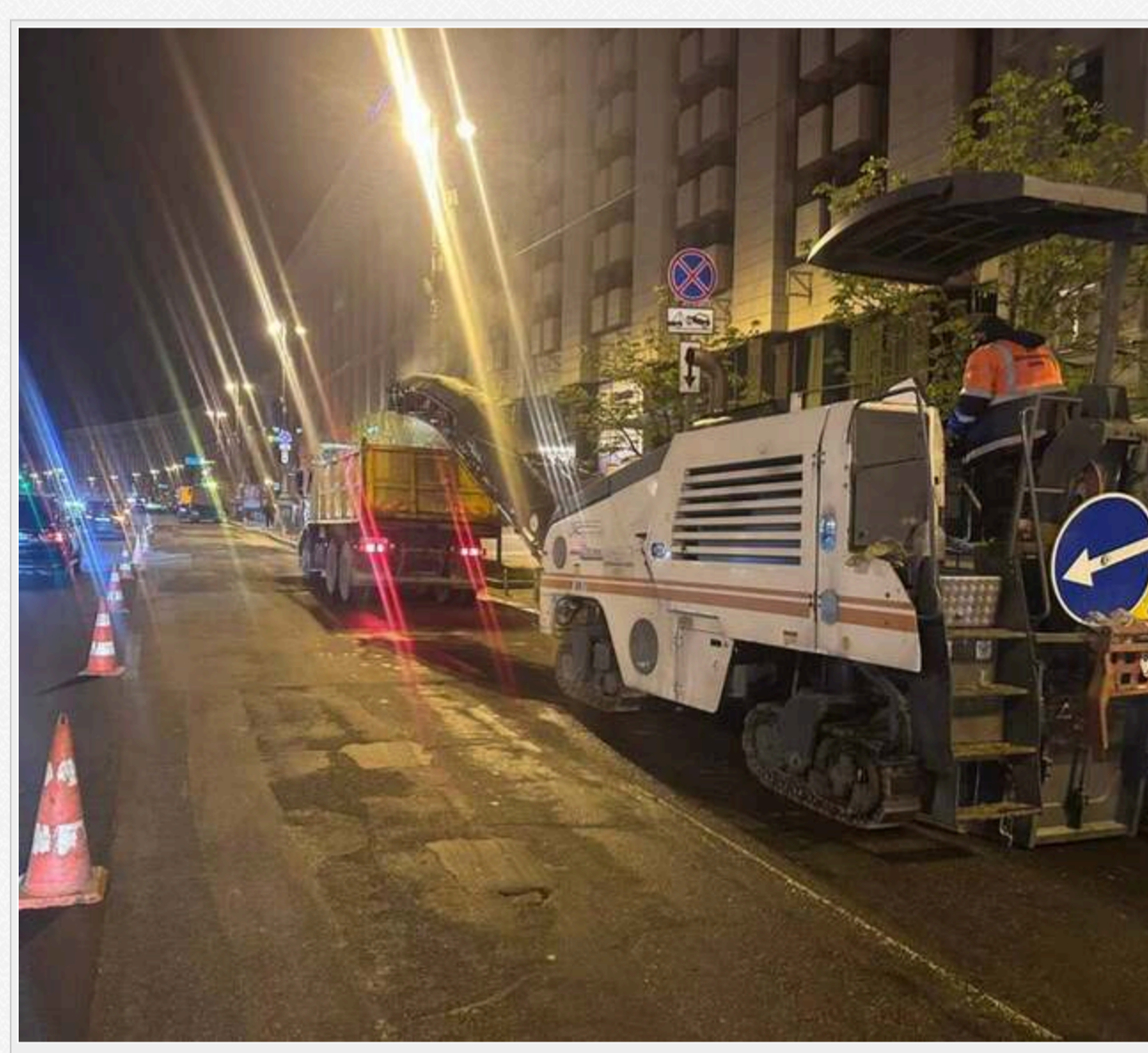
Ремонтні роботи на Хрещатику у квітні 2026 року

Зазначимо, що вулиця Хрещатик пролягає територією одразу двох районів – Шевченківського та Печерського. Водночас усі її проїжджа частина закріплена за КП «ШЕУ Шевченківського району Києва». Натомість КП «ШЕУ Печерського району» до обслуговування цієї магістралі не залучається .