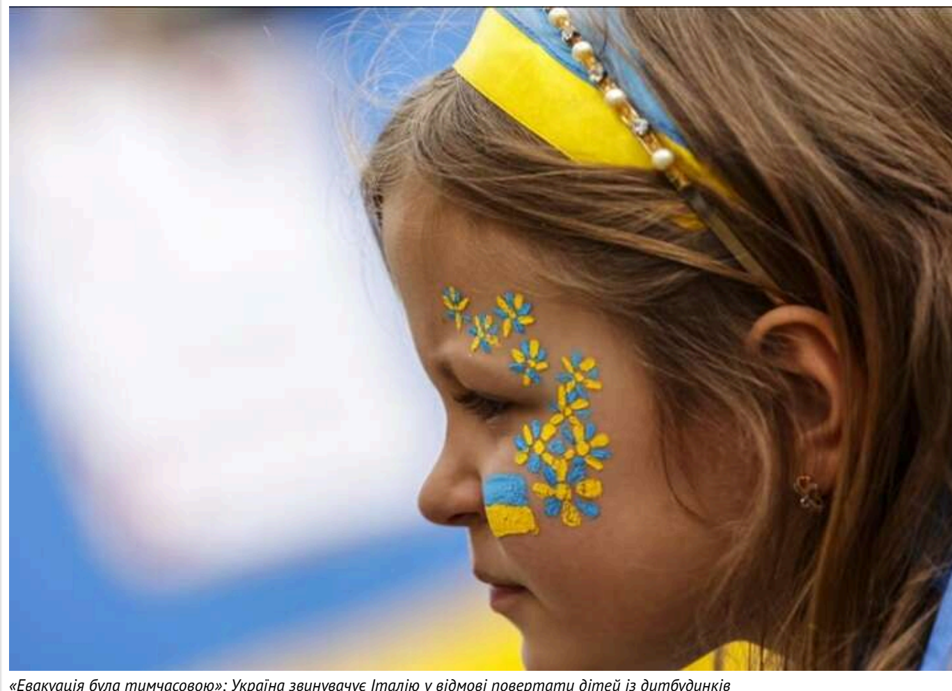
«Евакуація була тимчасовою»: Україна звинувачує Італію у відмові повертати дітей із дитбудинків

Читати на руськом Додати як бажане джерело в Google