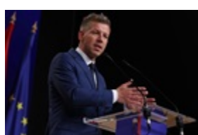
Мадяр заявив про "історичну угоду" з Україною

ОАЕ заплатять Ірану $20 млрд за припинення атак - ЗМІ