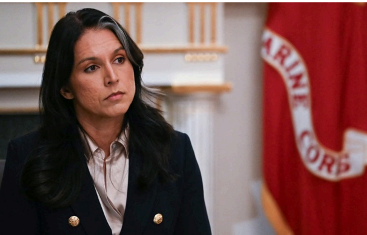
Очільниця Нацрозвідки США Тулсі Габбард

Одна з українських біолабораторій могла зберігати небезпечні патогени і залишалася під загрозою захоплення Росією.