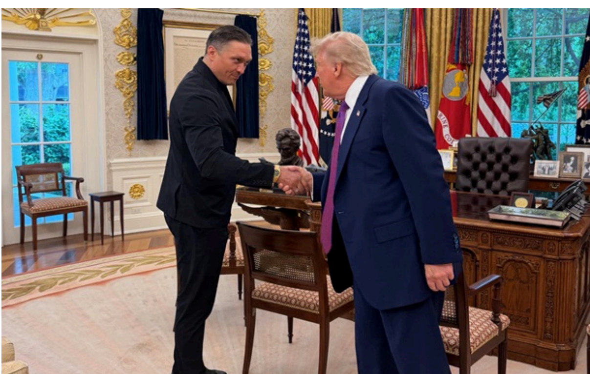
Усик і Трамп

Фото зустрічі опублікувала помічниця американського президента. З якою метою боксер і поолітик зустрічалися - не повідомляється.