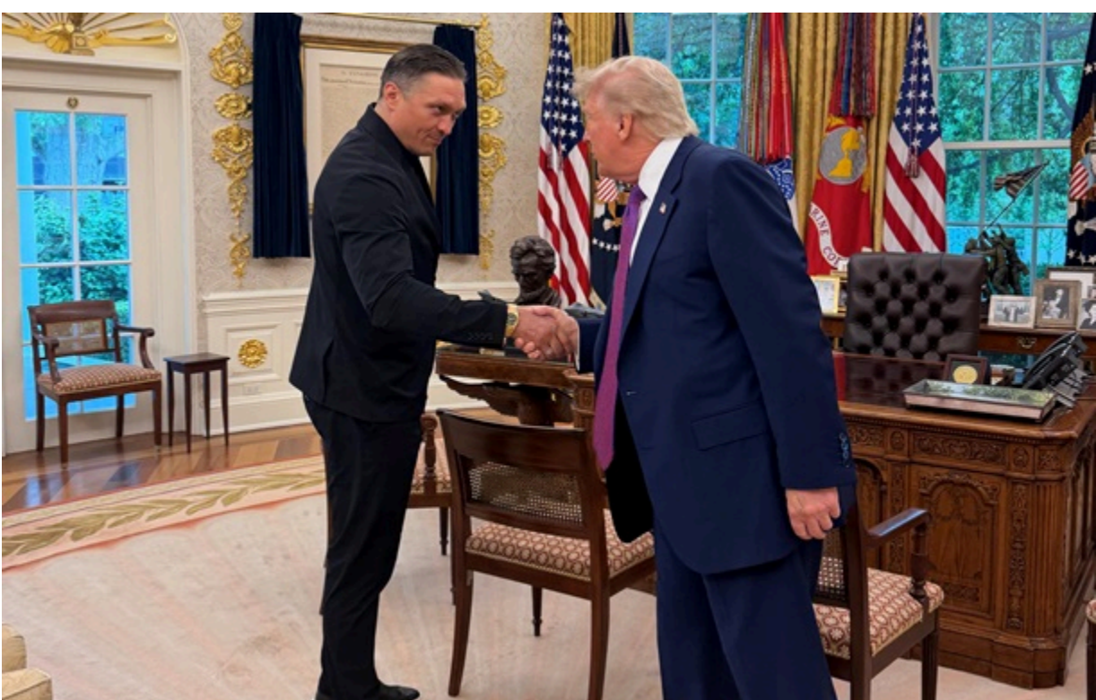
Усик і Трамп

Фото зустрічі опублікувала помічниця американського президента. З якою метою боксер і поолітик зустрічалися - не повідомляється.