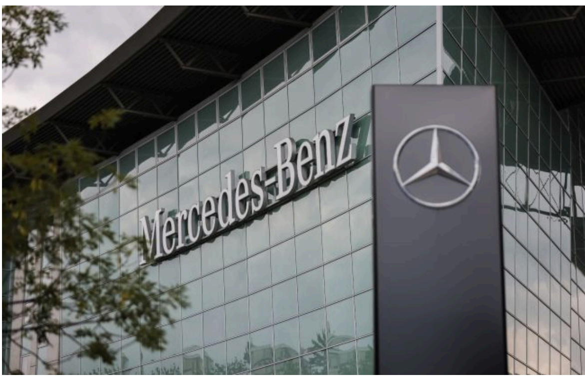
Фото: офіс компанії Mercedes-Benz