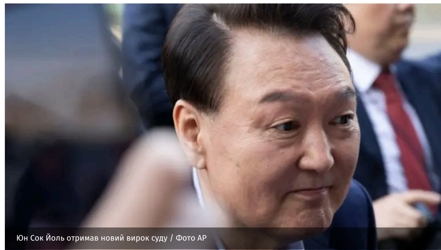
Юн Сок Йоль отримав новий вирок суду

Суд у Південній Кореї виніс новий вирок експрезиденту Юн Сок Йолю у справі про запуск безпілотників до Північної Кореї. Йому додали ще 30 років ув'язнення.