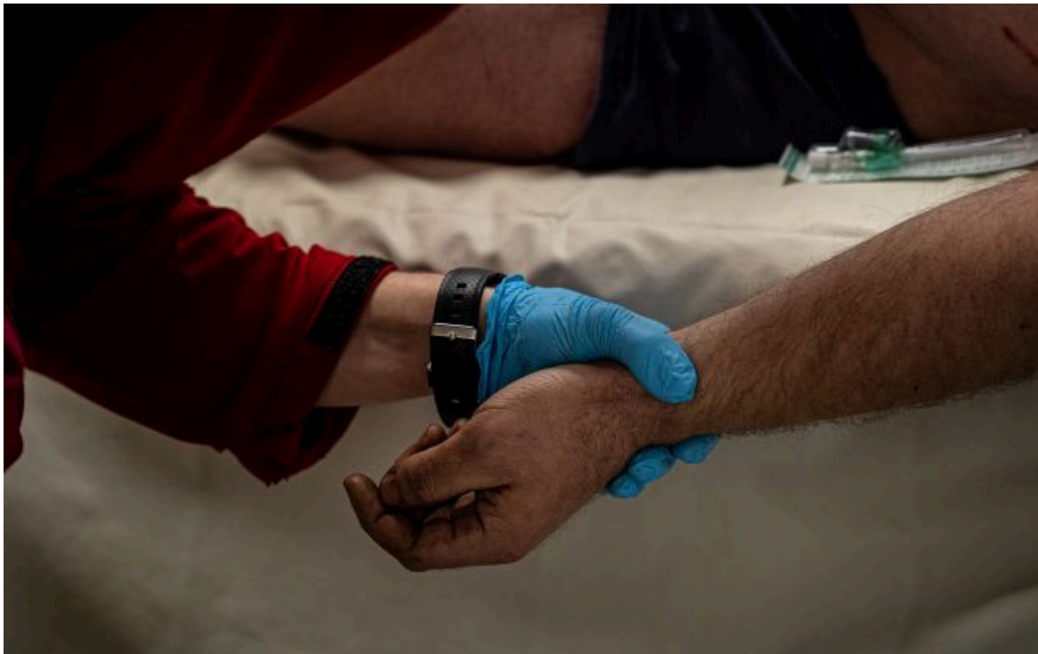
Фото: попередній антирекорд був зафіксований у квітні 2022 року