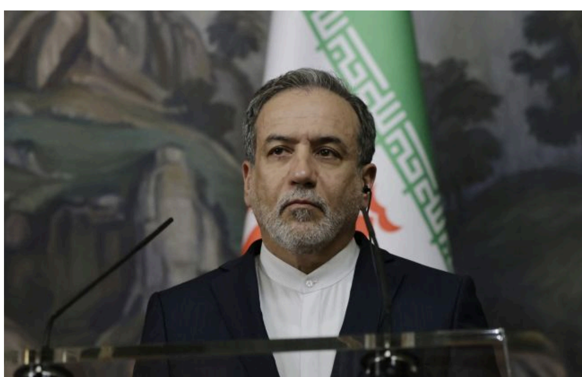
Фото: очільник МЗС Ірану Аббас Арагчі Getty Images)