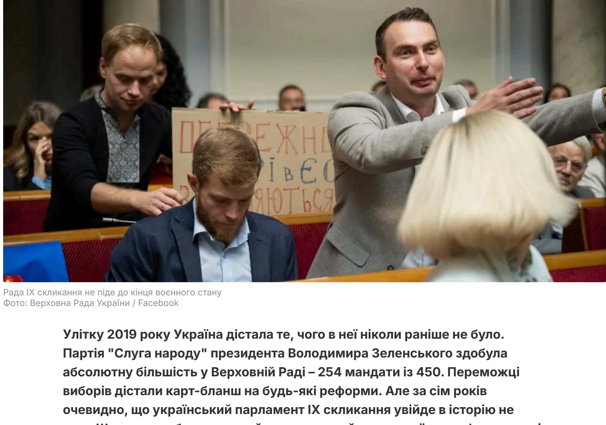
Рада ІХ скликання на під'їзді до кінця воєнного стану

13 червня, 00:18 👁️Цей матеріал також можна прочитати на російськом