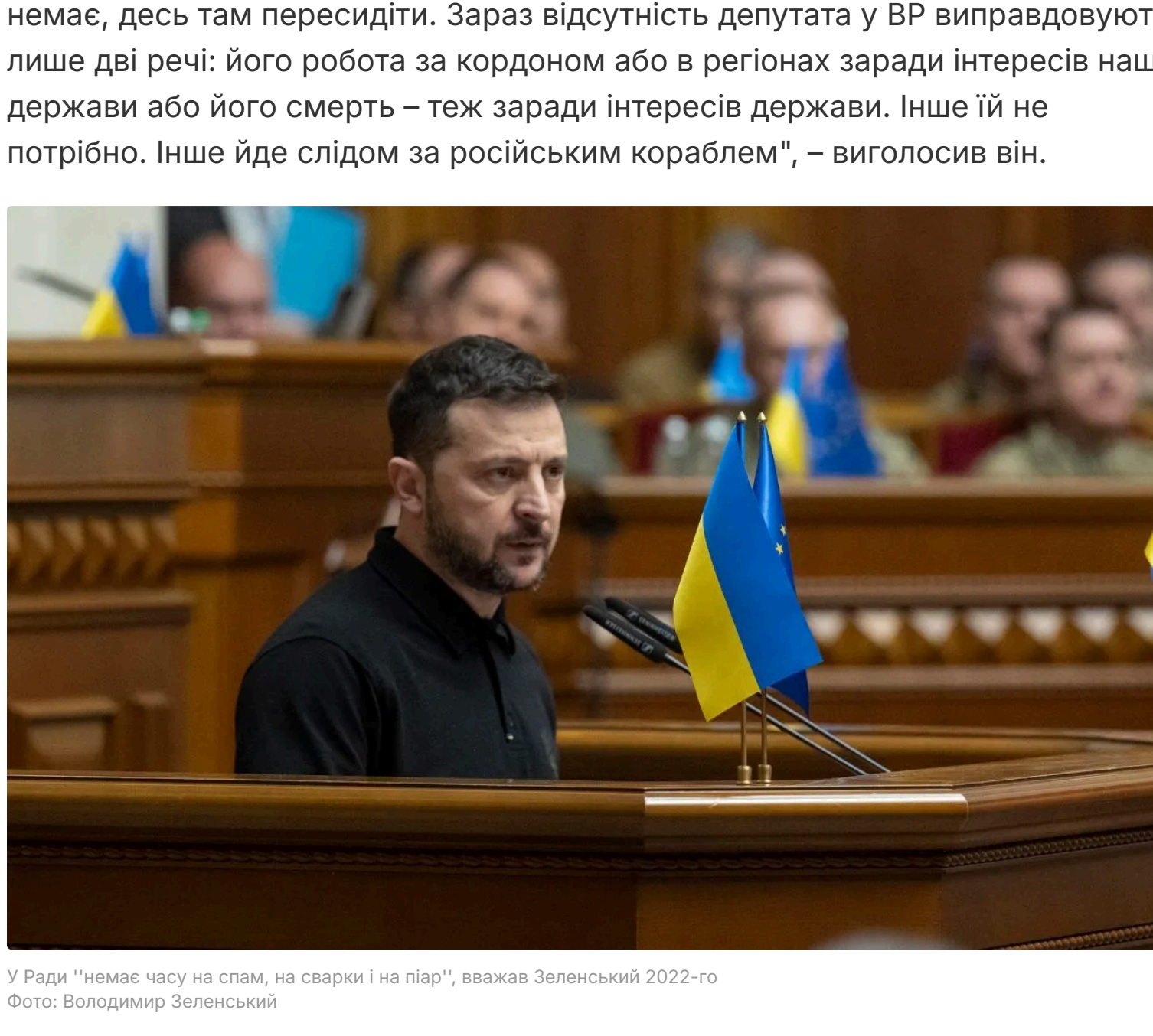
У Раді "чесно" чому не став, на оберті на піар", висловив Зеленський 2022-го Фото: Володимир Зеленський

"Це не зневага, а навпаки – це велика довіра до вас. Ви тут, і ви це чудово знаєте, що відбувається в нас, і ви чудово знаєте, що робити... Немає часу на спам, на саркази й на піар. Сьогодні в нас із вами одна партія – Україна, одна фракція – Україна, одна монобільшість – Україна. Усе, що їй не допомагає чи шкодить, має залишитися в минулому. Так само, як і чийсь надії, кого тут немає, десь там пересидіти. Зараз відсутність депутата у ВР виправдовує лише дві речі: його робота за кордоном або в регіонах заради інтересів нашої держави або його смерть – теж заради інтересів держави. Інше їй не потрібно. Інше йде слідом за російським кораблем", – виголосив він.